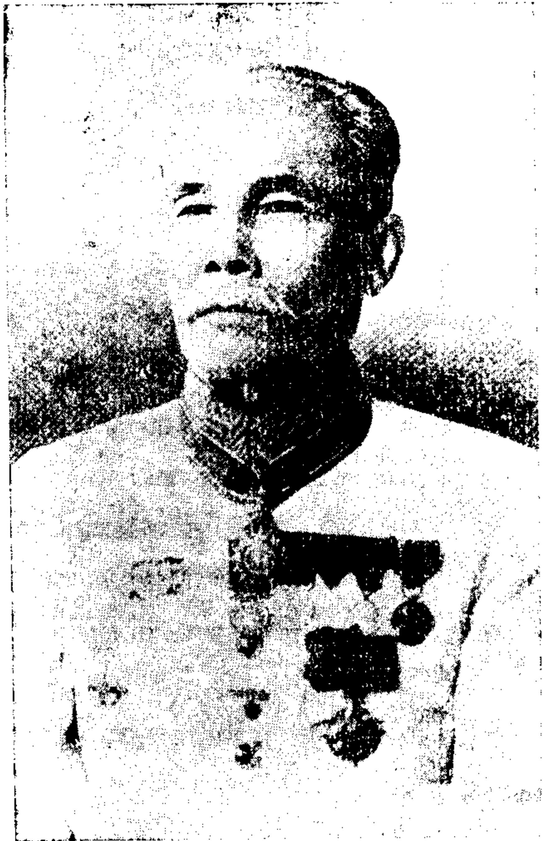
พระยาประมุลธนรัักษ์ (ผูก ฝโลประการ)